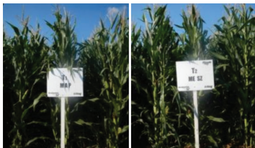
FOTOS: Superiores, parcela con MAP + Zn (izquierda) y parcela con MicroEssentials SZ (derecha).